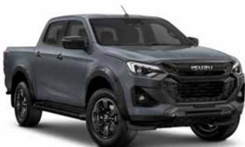
ISLAY GRAY (PERLEŤOVÝ EFEKT)