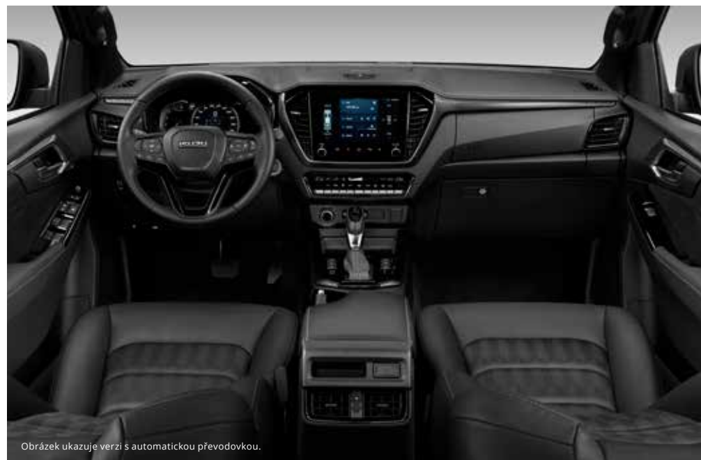
Obrázek ukazuje verzi s automatickou převodovkou.