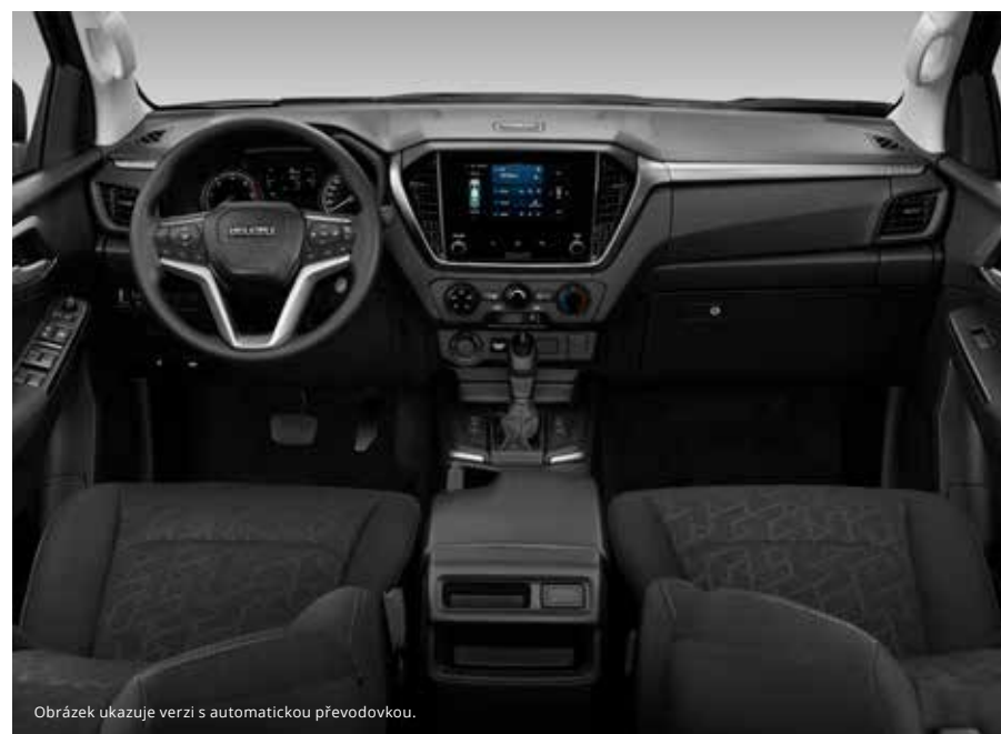
Obrázek ukazuje verzi s automatickou převodovkou.