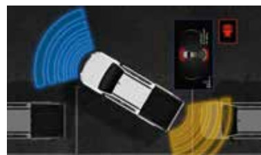
Parkovací asistent vepředu a vzadu