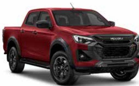
RED SPNEL (PERLEŤOVÝ EFEKT)