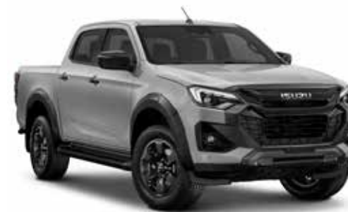
MERCURY SILVER (METALÍZA)