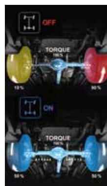
Uzávěrka diferenciálu připojitelná