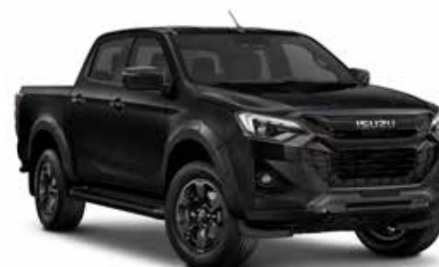
ONYX BLACK (PERLEŤOVÝ EFEKT)

12 let záruka na prorezivění (zevnitř ven). Metalické a Mica laky jsou k dispozici volitelně za příplatek. *Dostupné pouze pro výbavovou variantu V-CROSS.