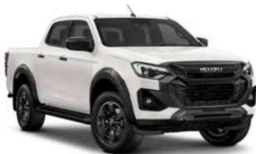
DOLOMITE WHITE PEARL* (PERLEŤOVÝ EFEKT)