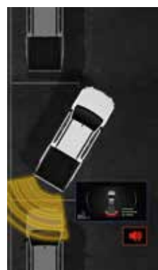
Parkovací asistent vzadu