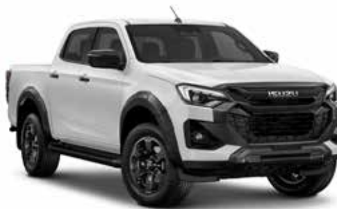
SPLASH WHITE (ZÁKLADNÍ)