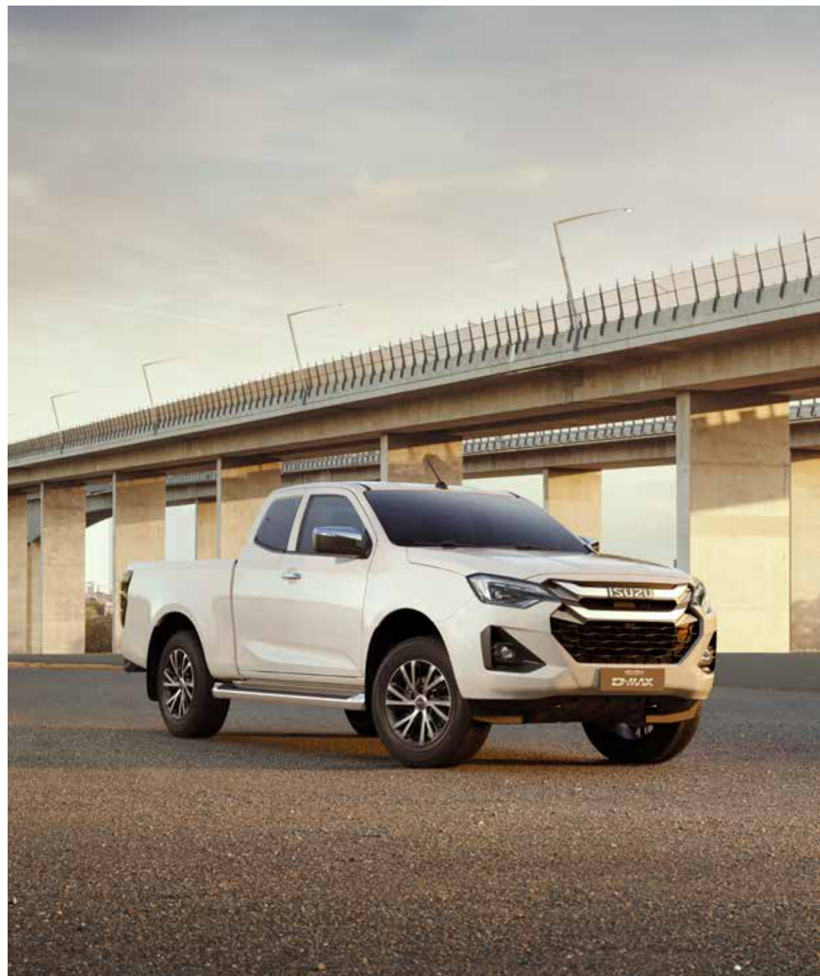
Na obrázku je zobrazen ISUZU D-MAX LSE jako Space Cab v laku Splash White.

D-MAX je spojením robustní konstrukce s vynikajícím technickým vybavením. S lehkostí v něm zvládnete jízdu jakýmkoli terénem a vychutnáte si absolutní stabilitu i na příkrých svazích nebo kluzkých silnicích. Asistent rozjezdu do kopce zabrání zpětnému pohybu vozu ve svahu. Asistent sjíždění z kopce vám poskytne další kontrolu na svazích. Při manévrování můžete využívat parkovací asistent a kameru pro couvání, abyste včas rozpoznali překážky kolem vozidla. Kromě jízdního komfortu nabízí D-MAX další funkce, které vám usnadní život, jako jsou automatický zámek dveří nebo světlo Follow-Me-Home-Light, které vám posvítí na cestu k domovním dveřím. Isuzu D-MAX se stává zážitkem.