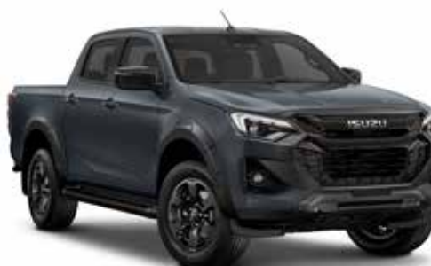
OBSIDIAN GRAY (PERLEŤOVÝ EFEKT)