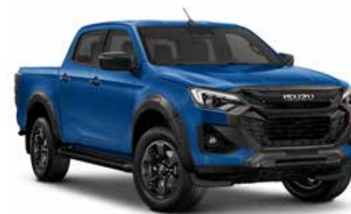
BIARRITZ BLUE (METALÍZA)