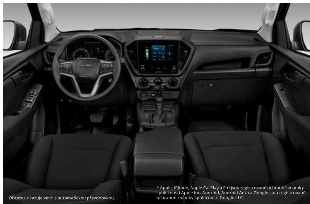
Obrázek ukazuje verzi s automatickou převodovkou.

* Apple, iPhone, Apple CarPlay a Siri jsou registrované ochranné známky společnosti Apple Inc. Android, Android Auto a Google jsou registrované ochranné známky společnosti Google LLC.