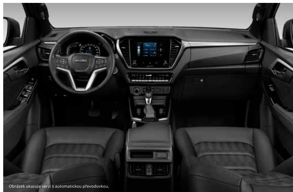
Obrázek ukazuje verzi s automatickou převodovkou.